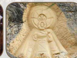
Virgen de las caras