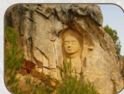
Dama del pantano

Virgen de las caras: Escultura inspirada en la Patrona de Buendía Nuestra Señora de los Desamparados.